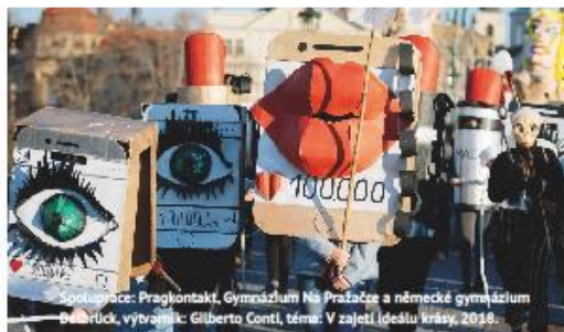
Spolupráce: Pragkontakt, Gymnázium Na Prašance a německé gymnázium Bismarck, výtvarník: Gilberto Conti, téma: V zajetí Idešlu krásy, 2019.

Sametové posvícení je satirický karnevalový průvod, který tematizuje nejruznější aktuální společenské problémy. Už od roku 2012 slavíme Den boje za svobodu a demokracii a Mezinárodní den studentstva poukazováním na to, co podle nás nefunguje dobře a je třeba s tím něco dělat.